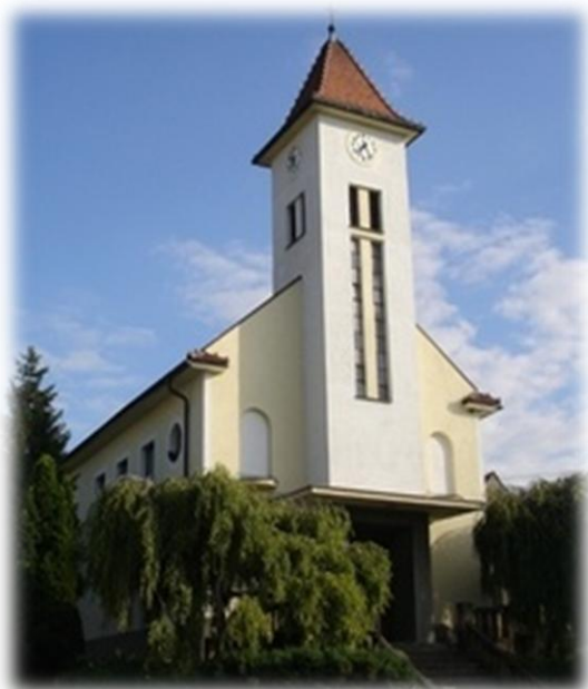
Kostel - současnost

Obec Žlutava leží na severozápadním okraji zlínského okresu v podhůří Chřibů a je součástí zpracovaného Velkého územního celku Chřiby, který se rozkládá na části čtyř okresů: Kroměříž, Uherské Hradiště, Hodonín a Zlín.