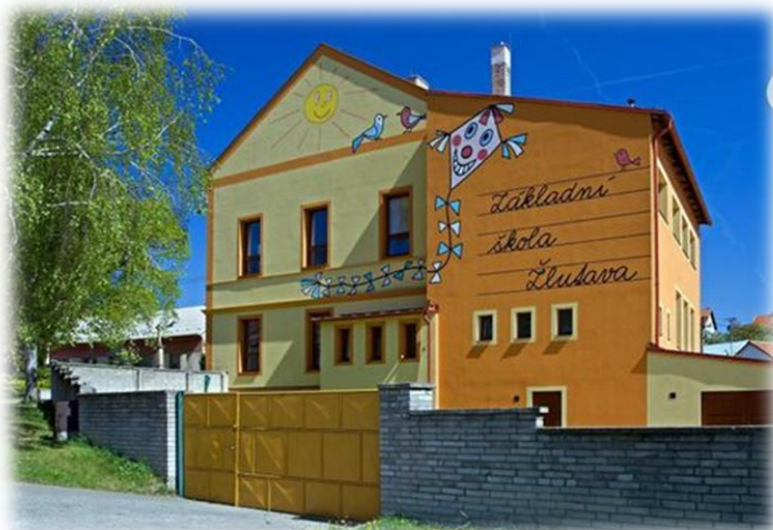
ZŠ Žlutava - současnost